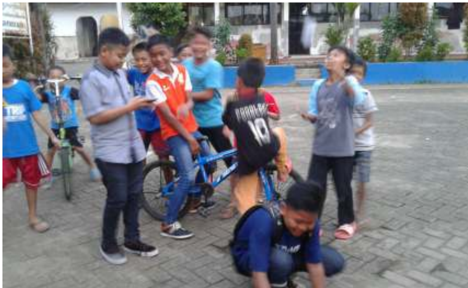
Gambar 2.1 Suasana yang terjadi di daerah parung jaya

Keadaan lingkungan di daerah Parung Jaya-Karang Tengah secara umum kondisi anak-anaknya lebih suka bermain, bermain games online dan hal-hal lainnya daripada membaca buku. anak-anak disini cenderung lebih suka bermain daripada belajar. Mereka, selepas pulang sekolah langsung pergi bermain bersama teman-teman sebayanya. Keadaan lingkungannya pun tidak menuntut anak untuk belajar. Hal ini, disebabkan karena faktor orang tua yang terlalu memberikan kebebasan kepada anak untuk lebih memilih bermain daripada belajar atau membaca buku.