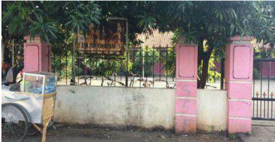
Gambar 2.2 Lokasi SD yang dekat dengan lingkungan daerah parung jaya

Walaupun keadaan daerah ini dekat dengan lingkungan sekolah (pendidikan) sangat memprihatinkan, faktanya bahwa masyarakat khususnya anak-anak daerah ini lebih suka bermain daripada belajar ataupun membaca buku. hal ini menunjukkan pula bahwa pengaruh dari pendidikan orang tua serta pengaruh lingkungan dimana anak tersebut berada menjadi faktor permasalahan yang utama.