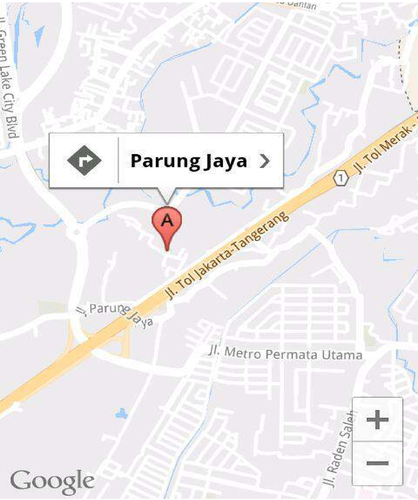
Lampiran 6. Denah Detail Lokasi Mitra Kerja